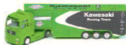
A.20 KAWASAKI RACING TEAM - TRUCK 2003 Replika des Kawasaki Racing-Team-Transporters. Nicht geeignet für Kinder unter 3 Jahren. E99990-322