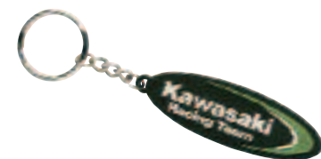
A.19 KAWASAKI RACING TEAM - SCHLÜSSELRING Logo im 3D-Design, Gummi. 70mm lang. 99985-190