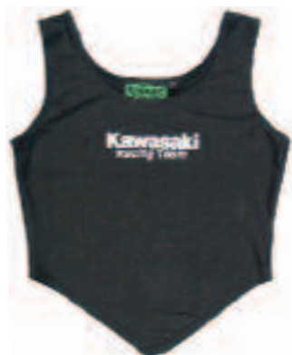
A.17 GIRLS TOP ONE SIZE FITS ALL Mit aufgedrucktem Logo. E99990-270