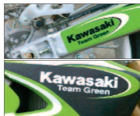
B.21 GRAPHIC-KIT 2004 Set mit Graphics für vorderes und hinteres Schutzblech, Radschwinge und Seite/Tankabdeckung 99985-237 - KX65 99985-238 - KX65 99985-239 - KX125/250 99985-240 - KX250F