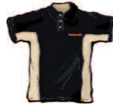
C.10 KINDER POLOSHIRT 116-164 80% Baumwolle/20% Polyester, 240g. 116 99990-253 140 99990-254 164 99990-255