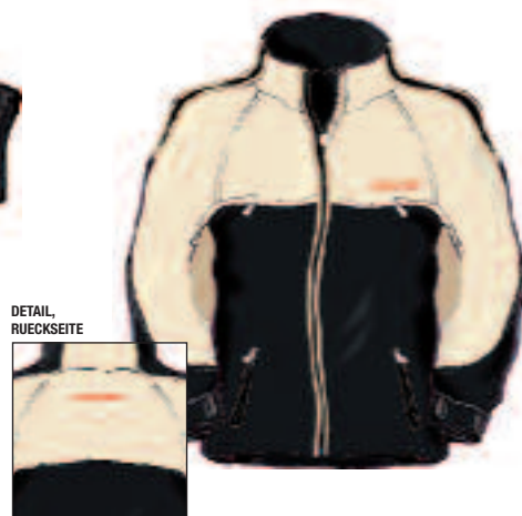
C.3 HERRENJACKE S-XXL Taslan Fine Tex, PVC-beschichtet, qualitativ hochwertiges Fleece-Futter. S 99990-220 M 99990-221 L 99990-222 XL 99990-223 XXL 99990-224