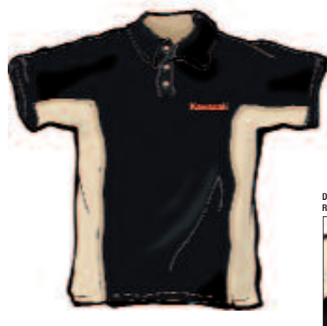
C.2 HERREN-POLOSHIRT S-XXL 80% Baumwolle/20% Polyester, 240g. S 99990-210 M 99990-211 L 99990-212 XL 99990-213 XXL 99990-214