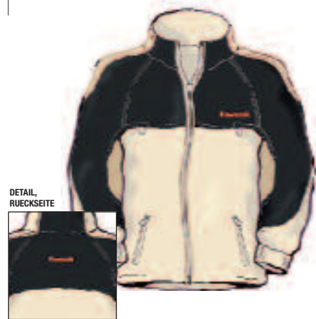
C.1 DAMENJACKE XS-L Taslan Fine Tex, PVC-beschichtet, hochwertiges Fleece-Futter. XS 99990-225 S 99990-226 M 99990-227 L 99990-228