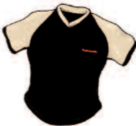
C.8 SKINNY, ENG GESCHNITTEN XS-L Schimmerndes Nylon in bester Qualität. XS 99990-200 S 99990-201 M 99990-202 L 99990-203