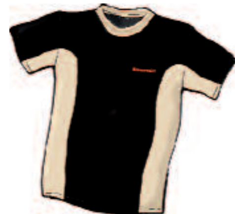
C.5 HERREN-T-SHIRT S-XXL 80% Baumwolle/20% Polyester, 240g. S 99990-215 M 99990-216 L 99990-217 XL 99990-218 XXL 99990-219