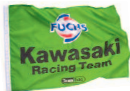
A.18 KAWASAKI RACING TEAM - FLAGGE 50 x 75cm. E99990-318