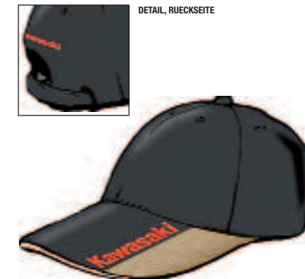
C.13 KAWASAKI CAP 100% gebürstete Baumwolle. 99990-258