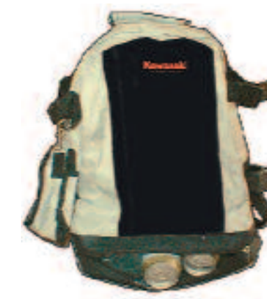
C.14 TRAVELLER RUCKSACK Diamond-Besatz, Nylon/Polyester-Futter, Handytasche, isoliertes Getränkefach. 99990-256