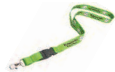
A.22 KAWASAKI RACING TEAM - NECKCORD Paddock-Pass-Halter. 20 x 90cm. E99990-319