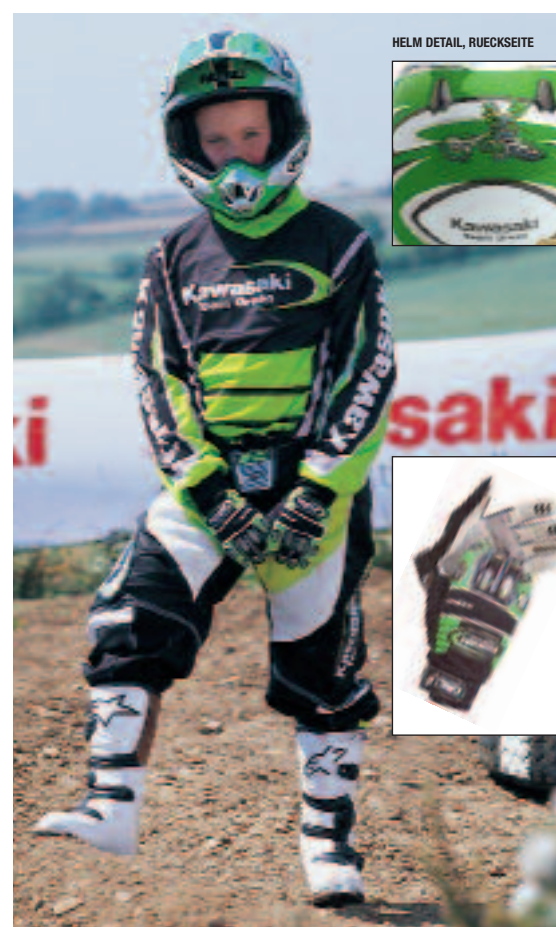
HELM DETAIL, RUECKSEITE