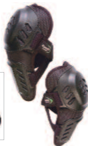
B.17 MX ELLBOGENSCHUTZ (PAAR) ERWACHSENE NEU! CE-Zertifizierung, Einheitsgröße. 99985-228