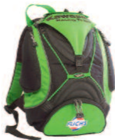
A.21 KAWASAKI RACING TEAM - RUCKSACK E99990-313