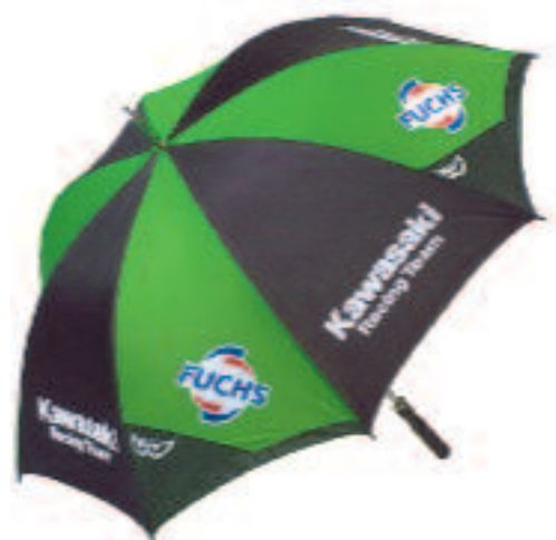
A.16 KAWASAKI RACING TEAM REGENSCHIRM E99990-310