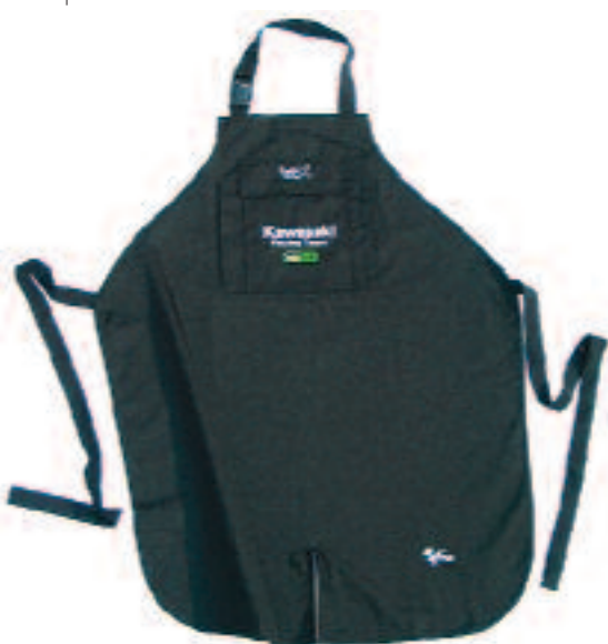
A.15 ARBEITSSCHÜRZE ONE SIZE FITS ALL Mit Sponsorlogos. E99990-265