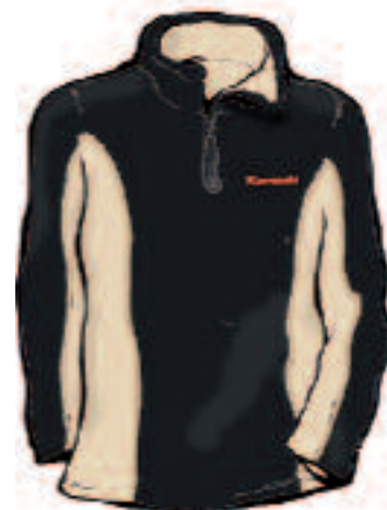
C.6 HERREN-FLEECE S-XXL Micro-Plus-Fleece, 280g. S 99990-235 M 99990-236 L 99990-237 XL 99990-238 XXL 99990-239