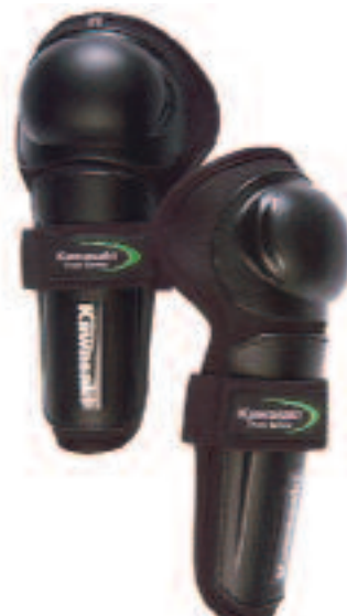
B.19 MX SCHIENBEINSCHUTZ (PAAR) ERWACHSENE NEU! CE-Zertifizierung, Einheitsgröße. 99985-227