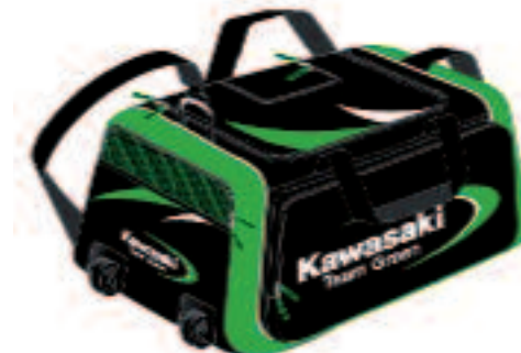
B.29 MX SPORTTASCHE NEU! Schweres Nylon mit Teleskopgriff. Größe 80 x 35 x 40cm. Erhältlich ab November 2003. 99985-236