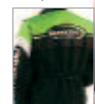
B.26 ENDURO-JACKE - KINDER XXXS-XS Leichte Jacke mit abnehmbaren Ärmeln. XXXS 99985-134A XS 99985-135A XS 99985-136A