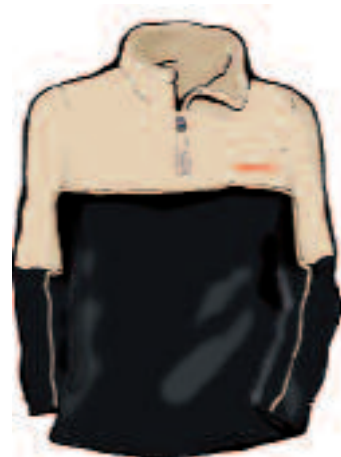
C.4 DAMEN-FLEECE XS-L Micro-Plus-Fleece, 280g. XS 99990-240 S 99990-241 M 99990-242 L 99990-243