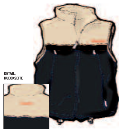
C.7 WESTE, UNISEX XS-XXL Taslan-Fine-Tex, PVC-beschichtet, qualitativ hochwertiges Fleece-Futter. XS 99990-229 S 99990-230 M 99990-231 L 99990-232 XL 99990-232 XXL 99990-233