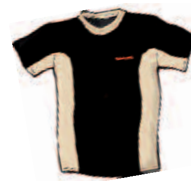
C.11 KINDER T-SHIRT 116-164 80% Baumwolle/20% Polyester, 200g. 116 99990-244 140 99990-245 164 99990-246