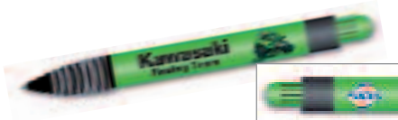
A.23 KAWASAKI RACING TEAM - KUGELSCHREIBER E99990-316