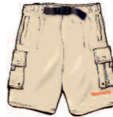
C.12 SHORTS, UNISEX XS-XXL 100% Baumwollshorts, preshrunk. XS 99990-247 S 99990-248 M 99990-249 L 99990-250 XL 99990-251 XXL 99990-252