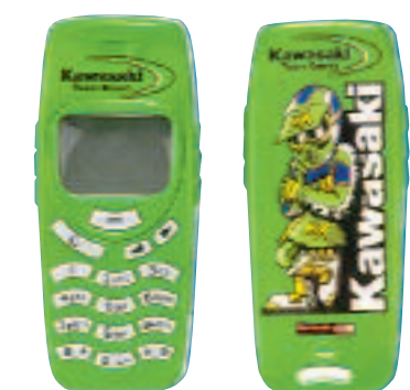
B.28 MX HANDY-COVER Anstelle des Original-Covers zu verwenden. NOKIA 3310/3410/3330 99985-506 NOKIA 8310 99985-507 NOKIA 3510 99985-508