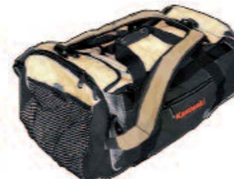
C.15 TRAVELLER SPORTTASCHE Nylon/Polyester-Besatz, Rucksackgurte, unterteilt, mit integriertem Fach für Schuhe/nasse Kleidung. 99990-257