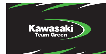
B.27 MX BADETUCH NEU! Schwarzes Badetuch, 150 x 75cm. 99985-235