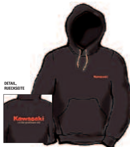
C.9 KAPUZENSWEATSHIRT, UNISEX XS-XXL Aus schwerem TC-Sweatshirt-Stoff. XS 99990-204 S 99990-205 M 99990-206 L 99990-207 XL 99990-208 XXL 99990-209