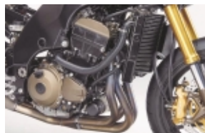
998 ccm Hubraum warten auf brennbares Gemisch ...