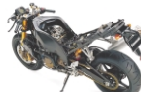
Ninja ZX-10R gestrippt: Ein Fahrwerk der Extraklasse ...