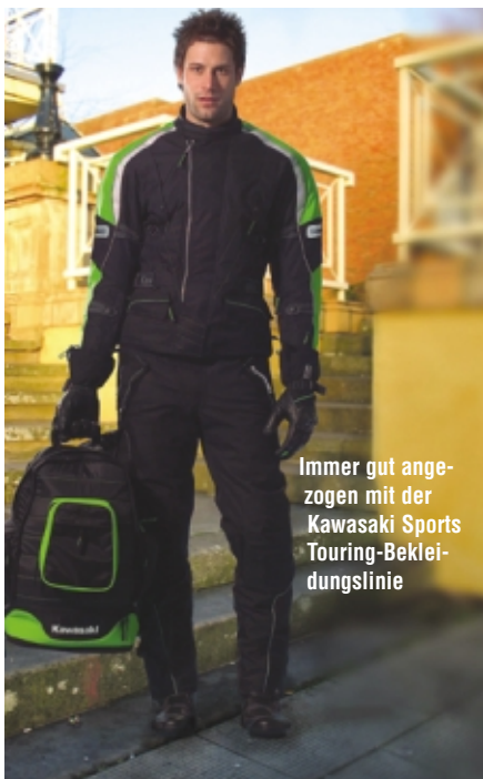
Immer gut angezogen mit der Kawasaki Sports Touring-Bekleidungsline

Das richtige Bike ist wichtig. Aber fast genauso wichtig ist die passende Kleidung. Im unserem Zubehörprogramm finden Sie deshalb eine große Auswahl an Funktionskleidung im Kawasaki Stil. Zum Beispiel den wasserdichten Kawasaki Sports Touring Fahreranzug , der bis zur Größe XXXXXL in Grün oder Grau erhältlich ist. Der Anzug besteht aus 500D Cordura und Schoeller Kevlar. Er verfügt über herausnehmbare CE-geprüfte KNOX Protektoren, ein herausnehmbares, thermoaktives Innenfutter, 3M Reflexstreifen, justierbare Taillenbänder sowie einen Verbindungsreissverschluss. Sommer- und Winterhandschuhe können ebenso passend dazu kombiniert werden wie ein neuer Motorradrucksack mit integriertem Helmbeutel. Diese Artikel sind bei allen Kawasaki Vertragshändlern erhältlich.