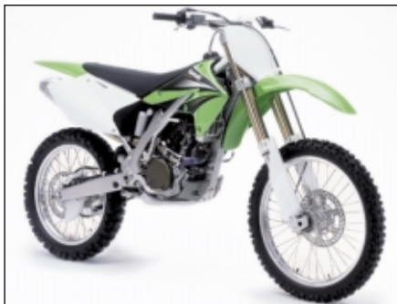
Die neue KX250F: Viertakt-Power fürs Gelände

Für alle Fans des Motocross-Sports hält Kawasaki ganz besondere Attraktionen bereit. Die neuen KX-Modelle für 2004 gehen Ende September an den Start.